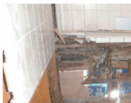
浴室のシロアリ被害