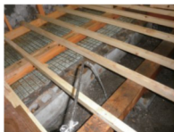
床をはがしての駆除工事